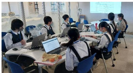
1日目：オリエンテーション

今後も本学では、職業体験の場を提供することで、未来ある若者の望ましい職業観・勤労観をはぐくみ、社会で生きる力の育成に貢献していきます。