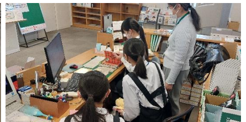
2日目：貸し出し・返却作業