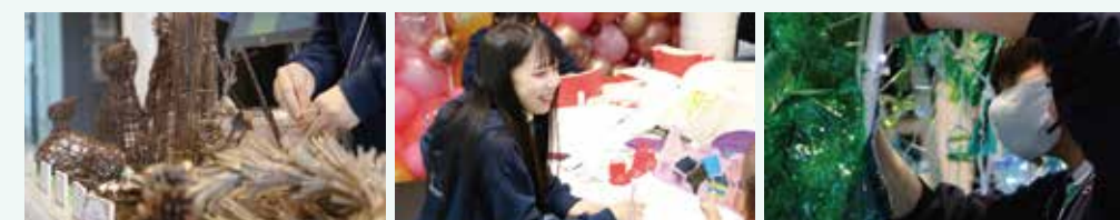
胡桃の木の樹皮を活用した学生オリジナルアート作品 ワークショップの様子

今回参加した学生からは、「子どもの視点になってワークショップを考えるのは難しかった。不安はあったが、自分たちが時間をかけて準備したものを楽しんでくれる様子を見てモチベーションが上がった」「プレメンズのinstagramに『親子で楽しむことができた』とメッセージをいただいたことが嬉しかった」などの感想が聞かれました。