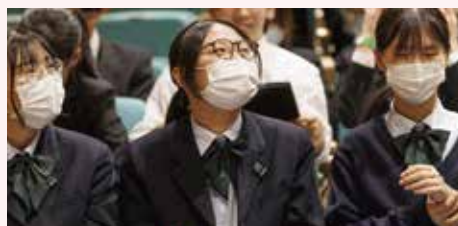
フォーラムを聴講した生徒たち

10月22日、「第15回コモンズ社会起業家フォーラム」(主催:コモンズ投信)が駒込キャンパスジャシーホールで開催されました。今年は、「あなたは今、どんな流れをつくりたいですか?」をテーマに、社会課題解決のために自ら行動を起こした10名の社会起業家たちが集結し、マイク1本と想いだけを手を、7分間のスピーチリレーを展開。当日は、イベント会場をオンラインで繋ぐハイブリッド型での開催となり、会場では約120名の参加者が白熱のスピーチに耳を傾けました。