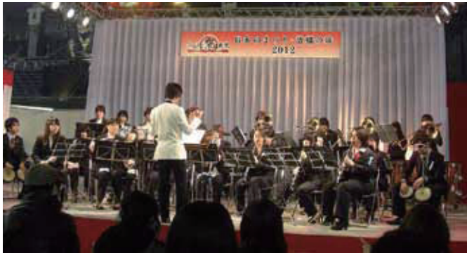
来場者を魅了したパワフルな演奏

約40万人が参加し、全国各地の祭りや物産が披露される「ふるさと祭り」東京2012が、1月7日から1月15日まで東京ドームで開催されました。 1月9日の「ふるさと特設ステージ」では、文京区観光協会からの要請で、本学の吹奏楽部が演奏しました。文京区には18の大学がありますが、特設ステージに立つのは本学が初めてということで、学生たちも演