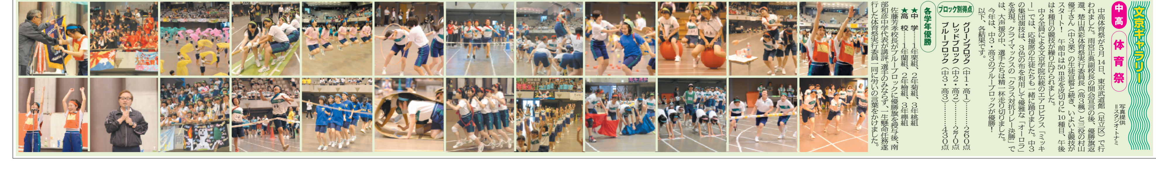
中高 体育祭

「書道」英会話「原始仏教」の学校は、主に決まりました。少しも教養が身に付いたらいいな、という思いが、この講座を知りました。自宅が近いので受講を決めました。