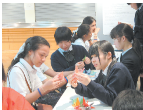
折り紙を習う PCCPの生徒(左)

2日目は、「サイエンス・フェア」を実施。午前は、サイエンス・プロジェクトと称して、4科目5分野(物理・化学・材料化学・数学・情報)の大学教授を招き、PCCPの生徒10名と、本校高2・3年理科クラス87名が、それぞれ学びたい科目を選択し、次年度の講義や実験に参加しました。