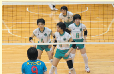
関東大会予選・共栄学園戦で熱い闘い

今後の日程は 1日目は、増穂商業(山 梨)戦、柏井(千葉)戦と もにストリートで破り、 2日目へ。第1 試合の西邑菜 (群馬)を破り、 準決勝・川崎橘 (神奈川)戦で も勝利。決勝の 春日部共栄(埼 玉)戦で1セッ トを取りました が、本校は僅差 で敗れ、準優勝 となりました。