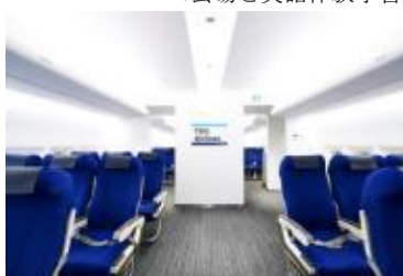
英語「を」活用するアトラクション・エリア (写真はエアポートゾーン)