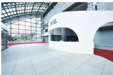
TOKYO GLOBAL GATEWAY