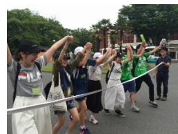
昨年の様子(到着時)