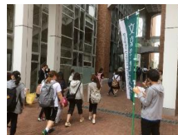
昨年の様子(出発時)

日 時：2017年5月27日(土)8時30分～18時00分 スタート地点：文京学院大学 本郷キャンパス※9時30分頃スタート (東京都文京区向丘1-19-1) ゴール地点：文京学院大学 ふじみ野キャンパス (埼玉県ふじみ野市亀久保1196)