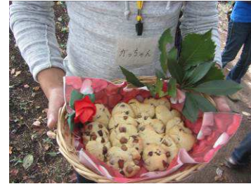
昨年の「森のムツレ教室」で子ども達が作ったオリジナルクッキー

日時：2015年10月10日(土) 10時00分～12時00分 集合：ふじみ野キャンパス 正門