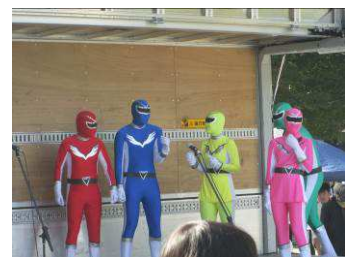
本学の「清掃戦隊モッタイナイレんジャー」