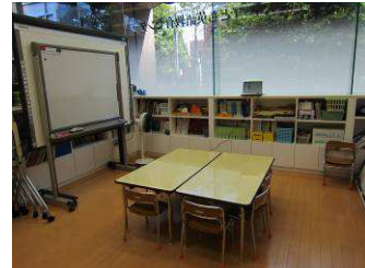
子ども英語教室の室内の様子