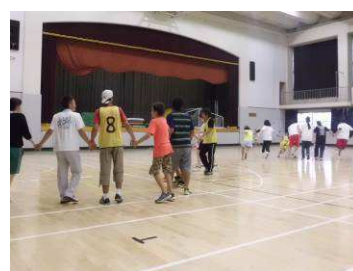
今年実施した「鬼遊び」の様子