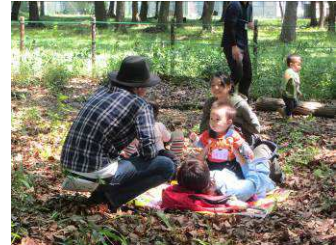
2015年5月に実施した 第1回「森っ子ベイビー」の様子