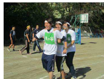
龍ヶ谷代表として活躍した学生達

龍ヶ谷は、人口約150名、平均年齢70歳弱の中山間地域で、豊富な自然資源を持つ一方、地域住民だけでは生活・自然環境や伝統文化の保全・継承といった、いわゆる「ふるさと」の維持が困難となりつつある地域です。