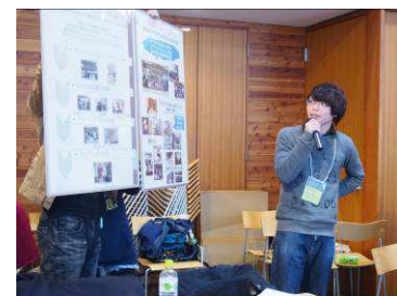
昨年の発表会でプレゼンを行った本学学生の様子

日時：2015年10月11日(日) 10時00分～15時30分 場所：ふくしま県民の森フォレストパークあだたら 森林学習館 住所：福島県安達郡大玉村玉井字長久保 68 参加：40名程度