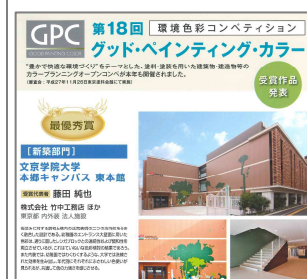
受賞作品パンフレットより

環境色彩コンペティション「グッド・ペインティング・カラー」は、1998年から毎年実施されており、今回で第18回を迎えました。過去には東京ゲートブリッジ(第15回新築最優秀賞)や東京スカイツリー(第15回新築優秀賞)なども受賞しています。1月6日(水)には、ホテルニューオータニ(東京)において表彰式が行われました。