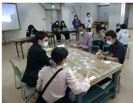
ワークショップの様子

今年で29回目となる「子どもの権利条約フォーラム2021inかわさき」は、日本で初めて子どもの権利の総合条例として制定された「川崎市子どもの権利に関する条例」から20周年を記念し開催されました。6日は、川崎市で作られた子どもの権利条約の20年をふりかえる基調講演のほか、全国の11団体で活動をする子どもたちの意見交換が行われました。7日は午前と午後合わせて22の分科会が開催され、外国ルーツの子どもの権利、障害をもつ子どもの権利、乳幼児の子ども権利などさまざまなテーマのもと、子どもたちの「遊ぶこと、学ぶこと、生きること、守り・守られること、参加すること」の大切さについて意見交換しました。