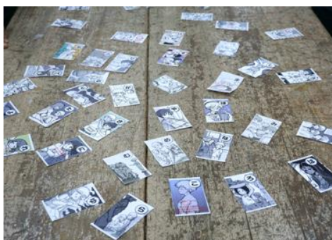
学生が制作した子どもの権利かるたと参加者の声