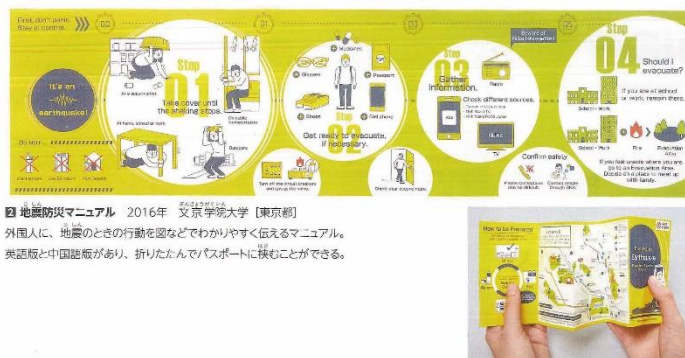
「地震防災マニュアル」掲載ページ