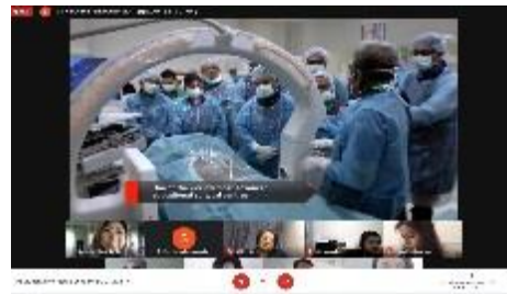
マレーシア国民大学紹介ビデオの様子