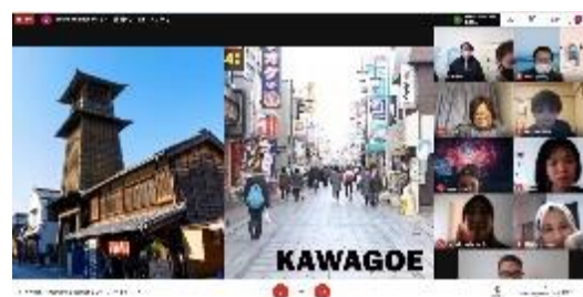
文京学院大学 発表の様子