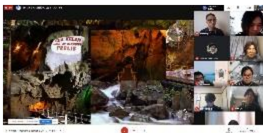
マレーシア国民大学 発表の様子

参加者 : 本学学生15名(当日参加は内8名)、教職員3名/マレーシア国民大学学生16名、教職員3名 内 容 : マレーシアと日本の美しい場所・文化のプレゼンテーション