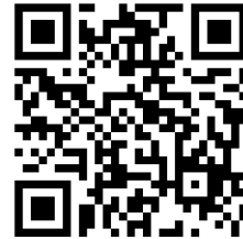
授業公開 アンケート