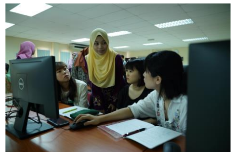
アジア圏で実施する海外プログラムの様子